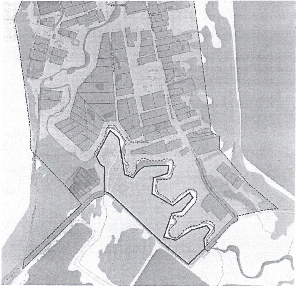
Схема расположения элемента планировочной структуры – территории, расположенной южнее деревни Кушелово городского округа Лотошино Московской области

Приложение к постановлению администрации городского округа Лотошино от 08.04. 2024 г. № 486